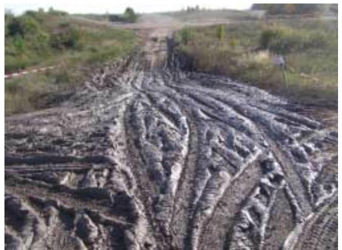
nach der Veranstaltung