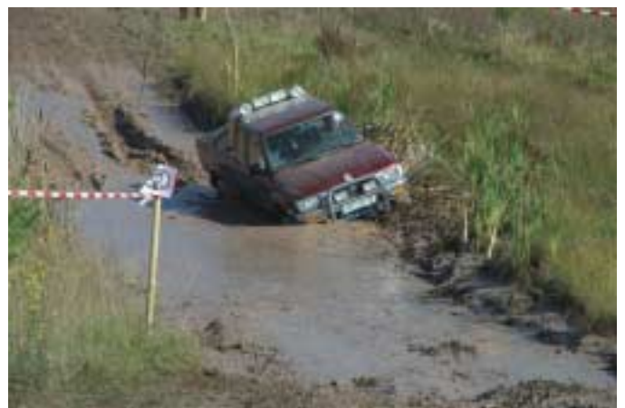
während der Veranstaltung