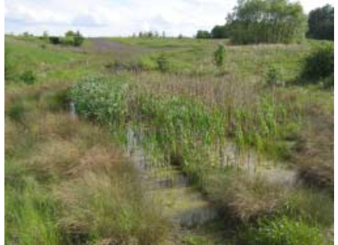
Biotop im Mai 2006

Die erste größere Veranstaltung hat aufgezeigt, dass bei einer Nutzung für Offroad-Zwecke der Naturhaushalt erheblich beeinträchtigt wird: