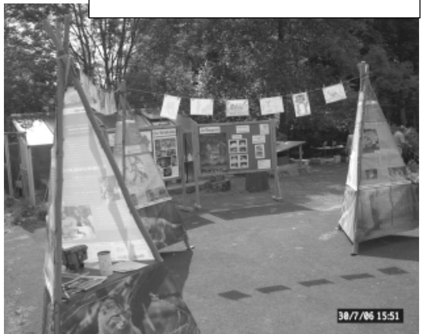
Die neue Wildkatzenausstellung wurde u. a. beim Dorfjubiläum in Fabrikschleichach im Juli 2006 gezeigt.