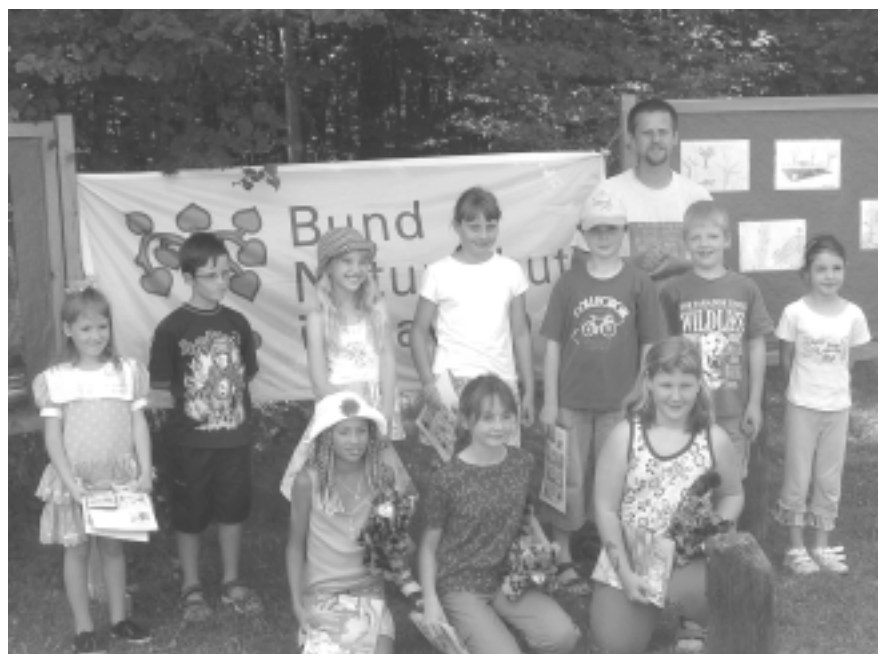
Die Gewinner des Wildkatzen-Malwettbewerbs

Seit einigen Jahren betreuen Schüler in Thüringen zusammen mit den Nationalparkwächtern im Hainich die Lockstockuntersuchungen. Diese Zusammenarbeit hat sich der BN als Vorbild für ein eigenes Schulprojekt genommen. Auch in Nordbayern wollen wir im kommenden Frühjahr ein Netzwerk zwischen Kreisgruppen und Schulen knüpfen, um gemeinsam in den Wäldern auf die Suche nach der Wildkatze zu gehen. Die Bayerische Sparkassenstiftung und die regionalen Sparkassen unterstützen das innovative Projekt